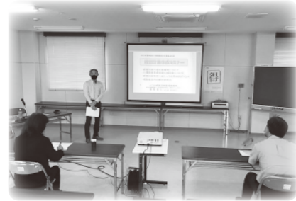
↑ 中小企業診断士による「経営計画作成セミナー」

商工会の会員は、様々な業種の事業者等で、全国で約79万事業者等が加入されています。加入している事業者の割合（組織率）は、全国平均で58.2%となっており、これだけの規模と組織率を有する団体は他にはありません。