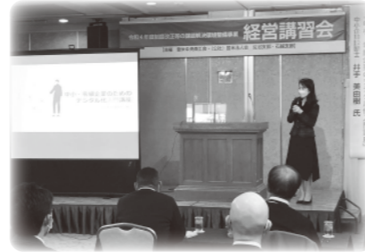
↑ DXへの初めの一步 デジタル化入門講座